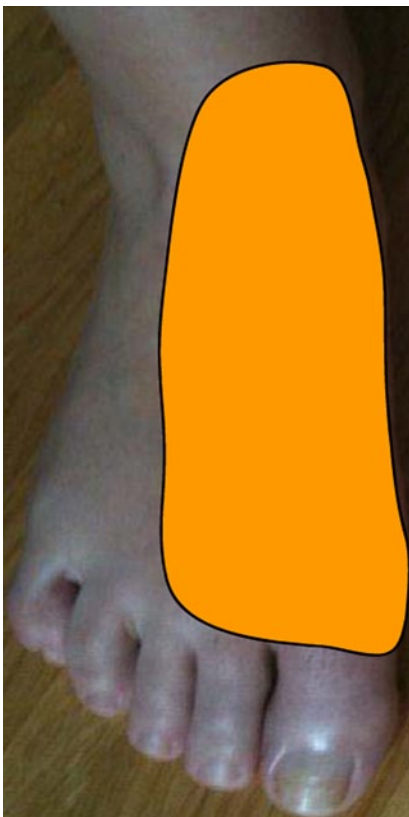
Abb. 4 ▲ Areal der Allodynie (orange), Ansicht von ventral (Areal der Allodynie im Bereich der Fußsohle hier nicht dargestellt)

Schmerz 2013 · 27:67–71 DOI 10.1007/s00482-012-1268-8