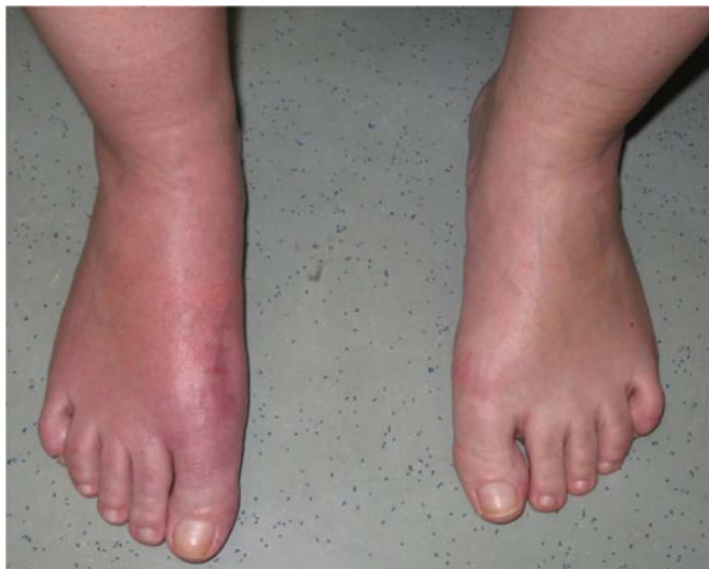
Abb. 5 ◀ Unveränderter Lokalbefund 4 Wochen nach Applikation von Capsaicin

Einschränkung des Bewegungsumfangs im rechten oberen Sprunggelenk; ausgeprägtes Pseudoneglect der rechten unteren Extremität; deutliche depressive Verstimmung. Die zuvor mobile Patientin war in dieser Zeit nur mit Stützkrücken mobil und setzte ihr rechtes Bein nicht ein. In der quantitativen sensorischen Testung konnte aber eine Ausdehnung des Areals der Hyperalgesie und Allodynie nicht nachgewiesen werden. Die lokale autonome Symptomatik blieb unverändert: keine Schwellung, Hautverfärbung oder Änderung des Haarwachstums (▣ Abb. 5 ).