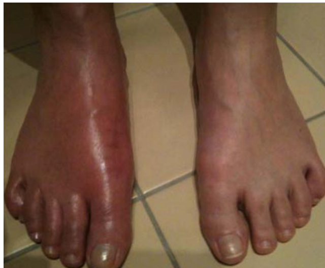
Abb. 1 ▶ Akutes Stadium 8 Wochen nach Halluxoperation

Gemäß den S1-Leitlinien der Deutschen Gesellschaft für Neurologie und dem