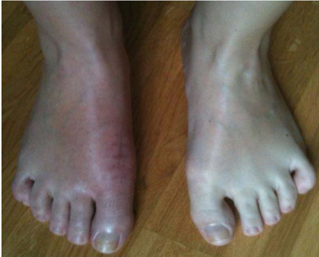
Abb. 2 ◀ Rückbildung der autonomen Symptomatik nach Therapieerweiterung

dort vorgeschlagenen Therapiealgorithmus [12] wurde 1-malig Bisphosphonat verabreicht, eine 4-wöchige Steroidbehandlung begonnen und eine Opioidtherapie mit Tramadol etabliert. Parallel wurde eine physikalische Therapie, primär eine Unterwassertherapie, eingeleitet und die Patientin in der Spiegeltherapie instruiert. Da diese Maßnahmen nicht ausreichten, wurden 5 Wochen später eine diagnostische Blockade des rechten lumbalen Grenzstrangs auf Höhe der Lendenwirbelkörper 2, 3 und 4 mit Bupivacain 0,5% positiv und nachfolgend eine Alkoholneurolyse durchgeführt. Es kam zu einer Schmerzreduktion auf einen VAS-Wert von 5 in Ruhe und 7 bei Belastung, einem deutlichen Rückgang der Schwellung und Hautverfärbung des rechten Fußes und zur Normalisierung des Bewegungsumfangs im rechten oberen Sprunggelenk (■ Abb. 2 ).